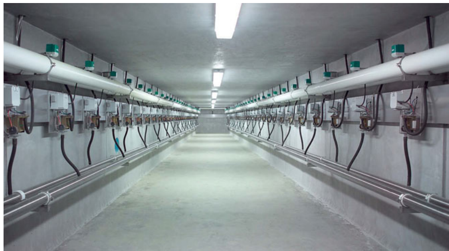
Versione: Global 90i Subway

Con questa versione i componenti di mungitura più importanti ai fini della manutenzione vengono montati sotto la buca di mungitura (Central Subway), o sotto la pedana capi (Dual Subway). Il sistema Subway offre garanzia di un ambiente di lavoro pulito, asciutto, facilmente accessibile e consente di effettuare gli interventi di manutenzione anche durante la mungitura. La vita utile di tutti i componenti più importanti risulta in questo modo prolungata.