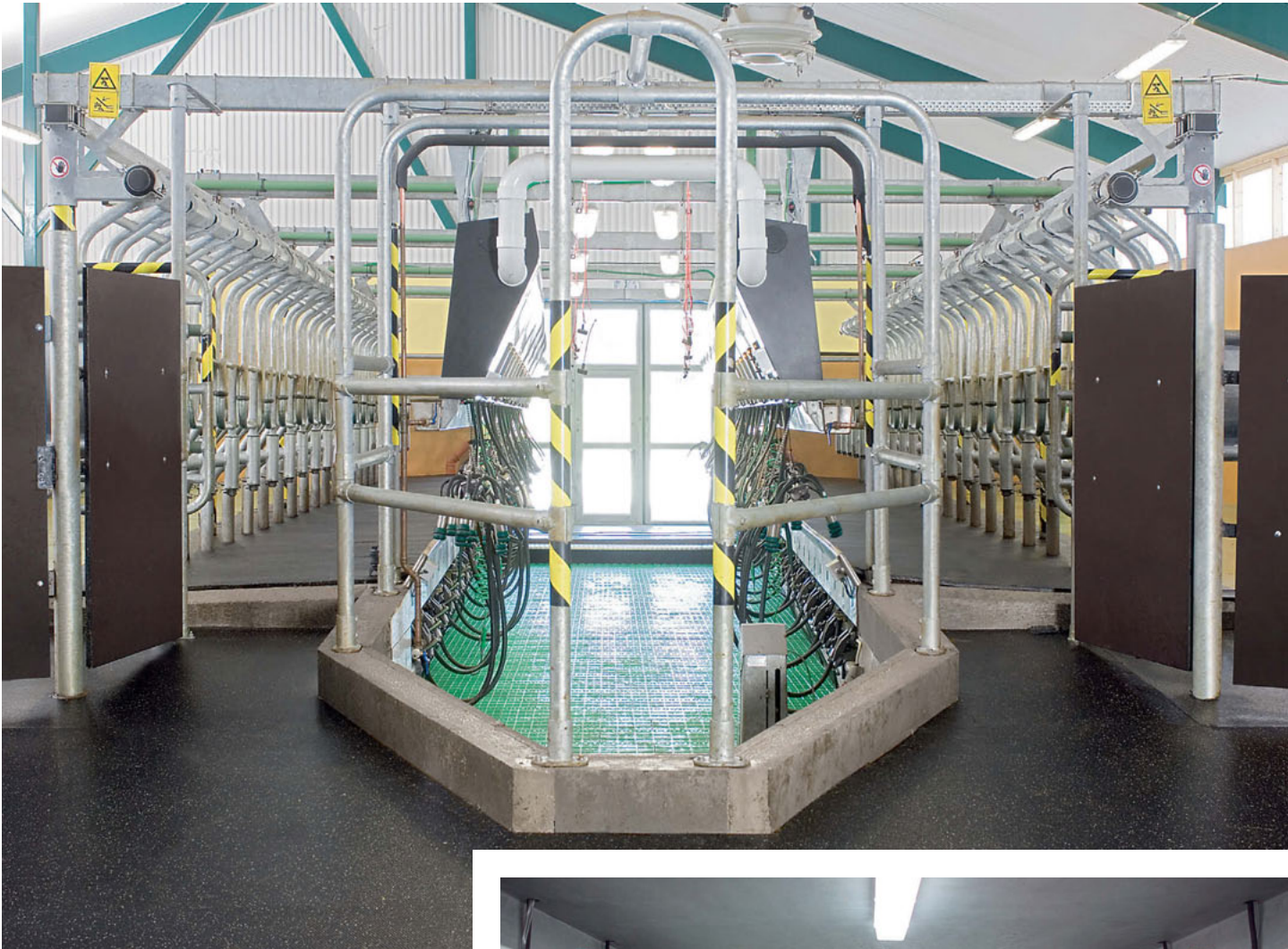
Versione: Global 90i senza Subway